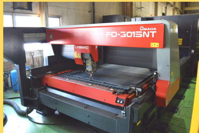
●二次元レーザー加工機